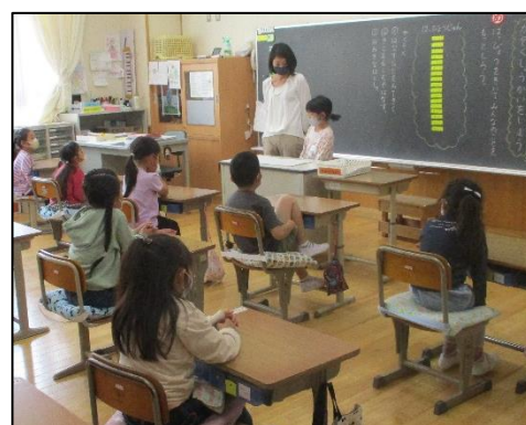
1年生は親子で発表しました