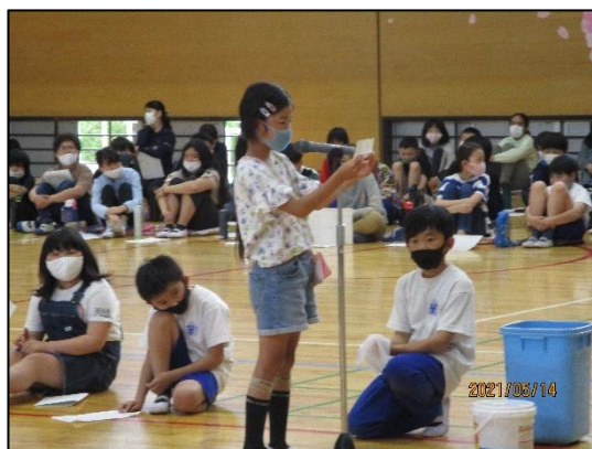
意見を発表する3年生

また、八田小学校がよりよくなるために取り組む4つの柱についても、一人ひとりが意識して継続していくことが大切です。毎朝鳴る『大望の鐘』を聞きながら、4つの柱を確認して生活していくようにしましょう。