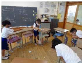
水族館からの挑戦状 ～釣れるものなら釣ってみろ～