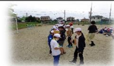
1年生にプレゼント (新入生歓迎会)