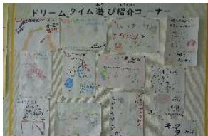
お店の紹介ポスター