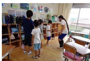
1位を目指せ ピンポン玉リレー