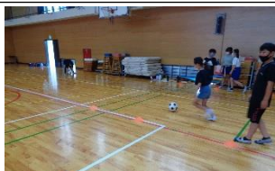
キックターゲット 全て倒せるかな 6年生からの挑戦状