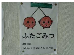
イメージキャラクター