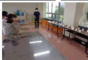
ねらった的を打ち倒せ 射的ゲーム