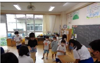
最高得点をねらえ！ ビー玉ラッシュ