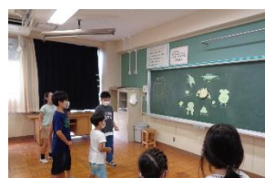
モンスターを倒して 得点をゲットしよう