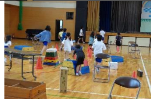
だるまからのミッション しょうがいぶつ だるまさんが転んだ