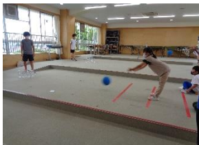
景品ゲットを目指せ ザ・ボーリング

◎「他学年とのつながりを意識して楽しく遊ぼうドリームタイム」のテーマのもと、12個のお店を順にまわり、みんな仲よく楽しいひとときを過ごしました。