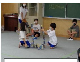
天までとどけ 缶積み大会