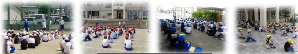
色開きでの活動の説明