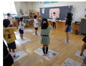
最後まで生き残れ 新聞の上でジャンケン大会