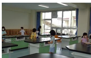
急いで見つけろ 宝探しゲーム