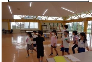
君はどこまで飛ばせるか ペーパージェット