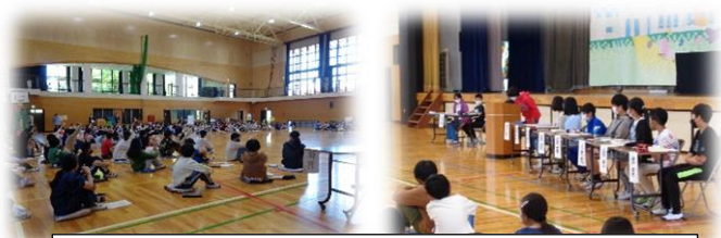
児童総会ではたくさんの意見がでました