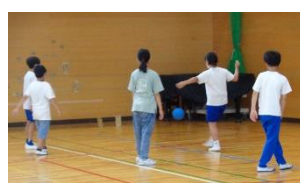
六年生からの挑戦状 狙って当てるキックターゲット