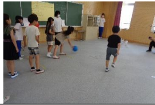
ポイントを稼ごう ボーリング大会！！