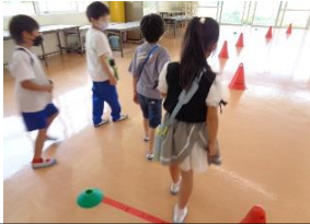
障害物を避けろ 目隠し迷路！！