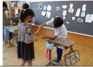
モンスターを倒せ！ 射的ゲーム！！