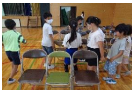
障害物 だるまさんが転んだ