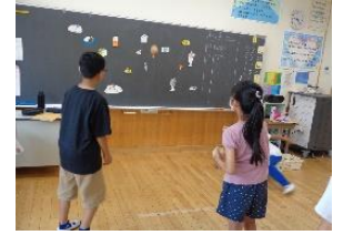
ポイントを競え！！ 食べ物まとあてゲーム