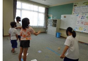
点数を勝ち取れ まとあてゲーム