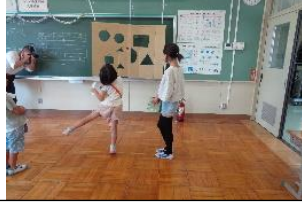
狙ってつらぬけ！！ 新聞ダーツ