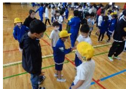
1年生にプレゼント (新入生歓迎会)

7月13日に行われた代表委員会では、6、7月のめあて「室内での過ごし方に気を付けよう」のふり返りを発表したり、「夏休みのめあてチェックシート」の取組について意見を出したりしました。各クラスから出された意見には、八田小をもっとよくしていこうという気持ちが表れていました。これからも児童会のテーマを意識して学校生活が送れると良いですね。