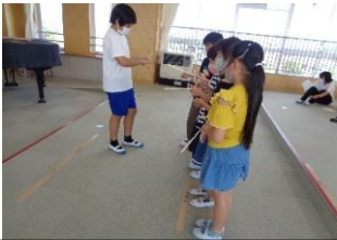
狙いをさだめろ 射的ゲーム！！