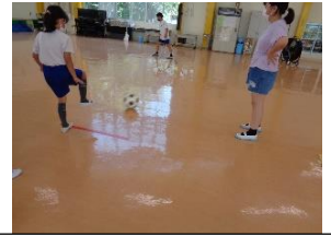
ボトルを倒せ！ ボールキックゲーム