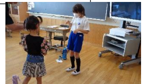
体で伝えろ!! 伝言ジェスチャーゲーム