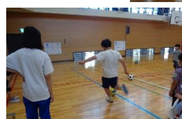
ボールを当てる!! 的あてゲーム!!