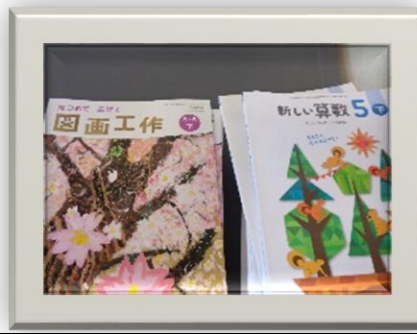
「下」の教科書が配布されました