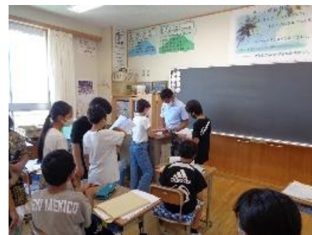
夏休みの宿題を集める5年生