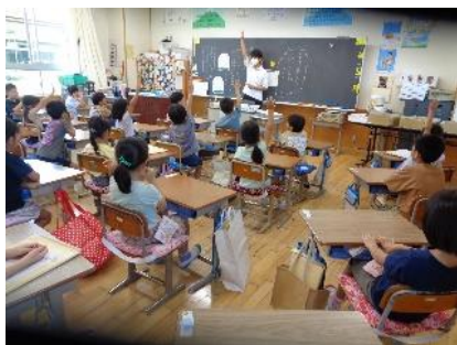
元気に手を挙げる1年生