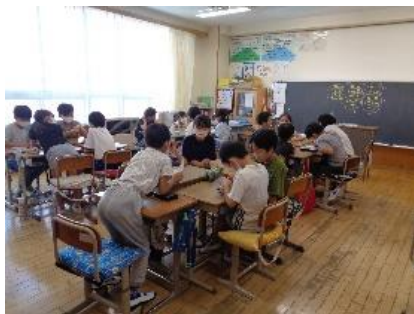
班の係について話し合う4年生