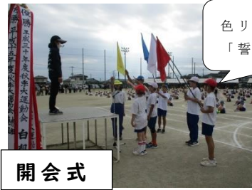
色リーダーの「誓いの言葉」