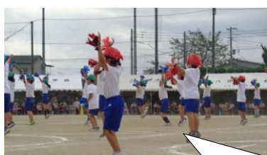
手首にキラキラボンボン、頭にはバンダナ。ディズニーの曲に合わせてスマイルダンスを披露しました。