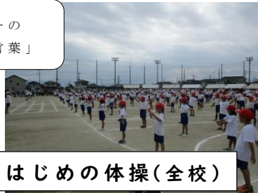
はじめの体操(全校)