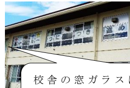
校舎の窓ガラスに貼られたテーマのように思いが一つになり、つき進みました。