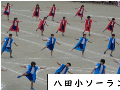
八田小ソーラン(3・4年)