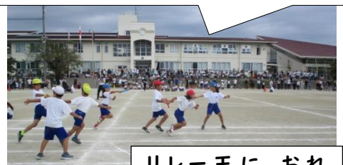
リレー王におれはなるっ!!!! (3年)