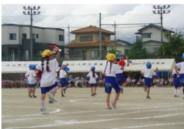
レッツ・スマイル😊ダンス!(1・2年)