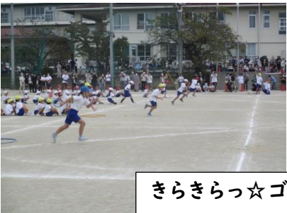
きらきらっ☆ゴー!(2年)