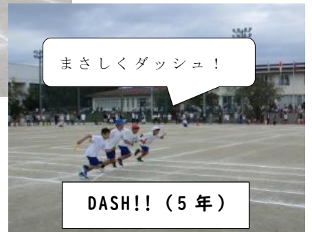
まさしくダッシュ!