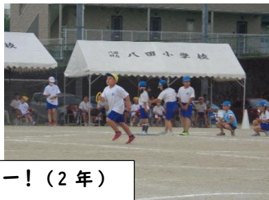
初のトラック半周です。バトンを落とさないように何度も練習しました。