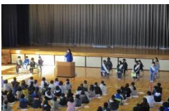
立会演説会の様子

選挙活動期間中は、廊下に立候補者のポスターが貼られ、立候補者は、朝、中休み、昼休みに大きな声で「こんな学校にしたい」という決意を伝えていました。また、各立候補者の学級の仲間がそれぞれを応援し、立候補者の良さをピールしていました。